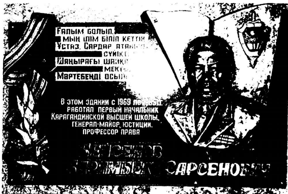
Памятная доска в Карагандинской высшей школе, установленная в сентябре 1998 г.