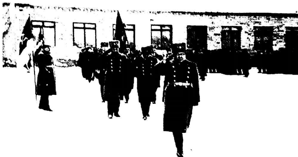
1973 г. г. Караганда Моржественное прохождение по брегену Красного знамени Карагандинской высшей школе